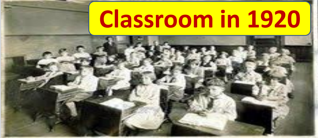
Classroom in 1920